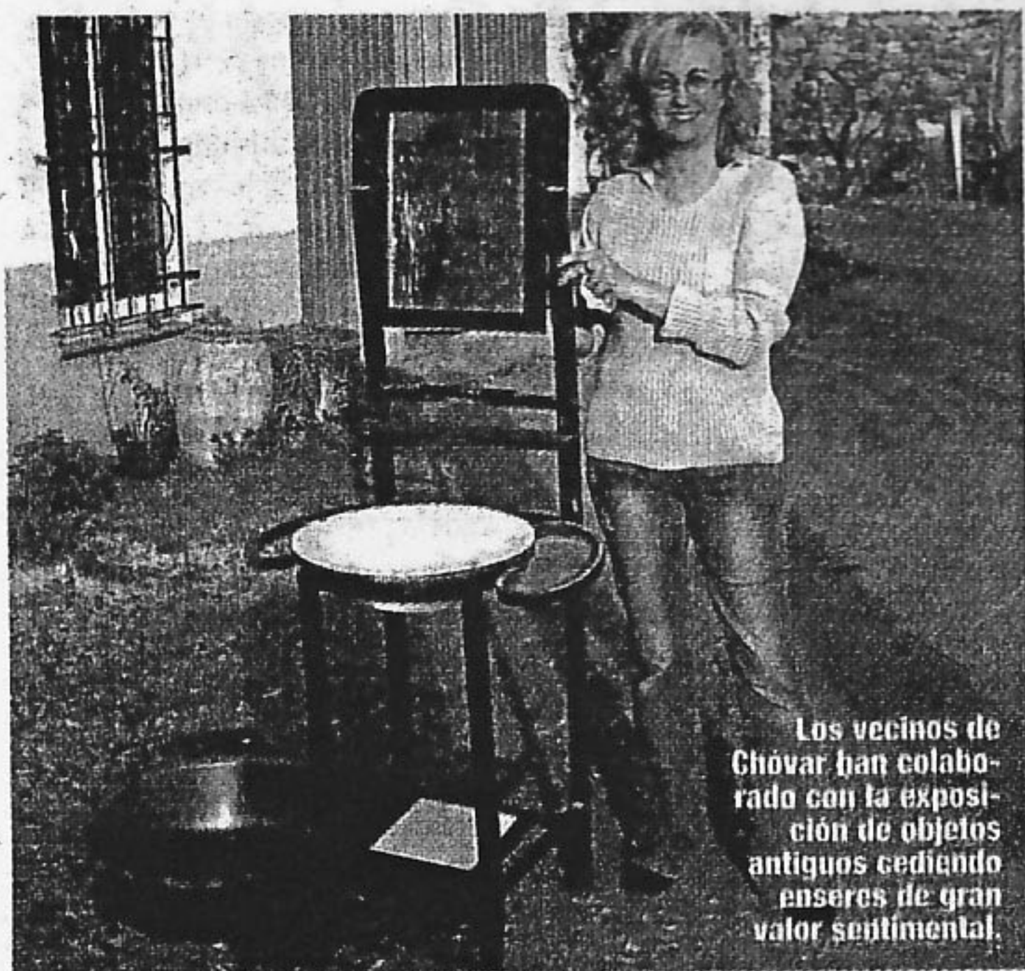
Los vecinos de Chóvar han colaborado con la exposición de objetos antiguos cediendo enseres de gran valor sentimental.

José Martí Coronado ■ CHÓVAR